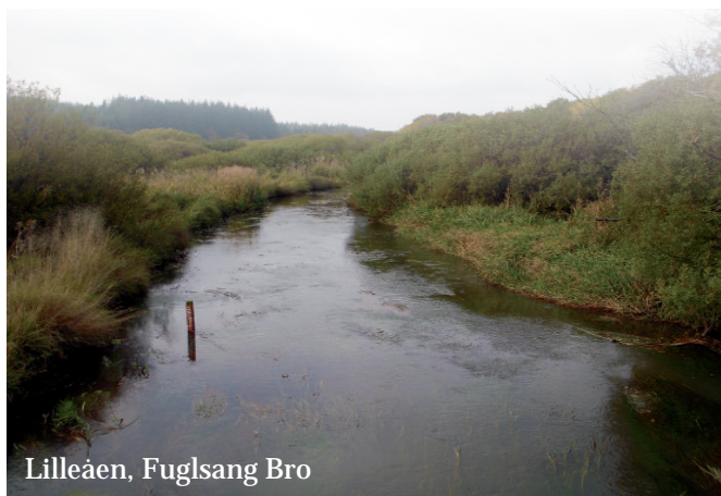
Lilleåen, Fuglsang Bro

Enkelte steder, hovedsageligt i byerne, er opsat højthængende skilte i rutens farve og med sort pil.